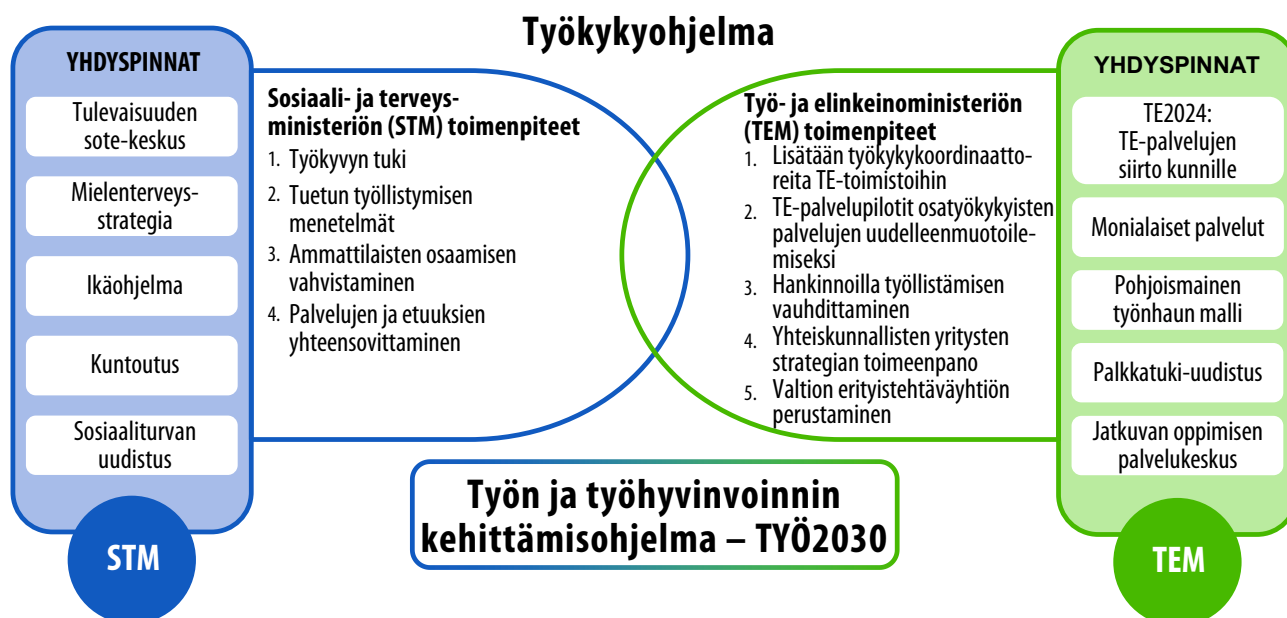
Kuvio 1. Työkykyohjelman toimenpiteet ja yhdyspinnat