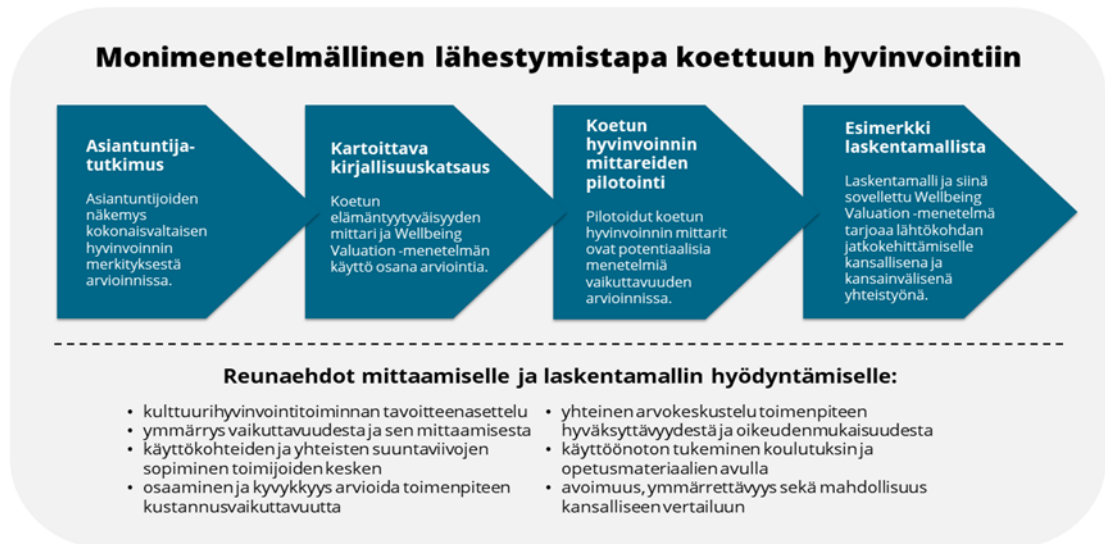
Kuvio 2. Prosessikuvio monimenetelmällisestä lähestymistavasta koettuun hyvinvointiin.