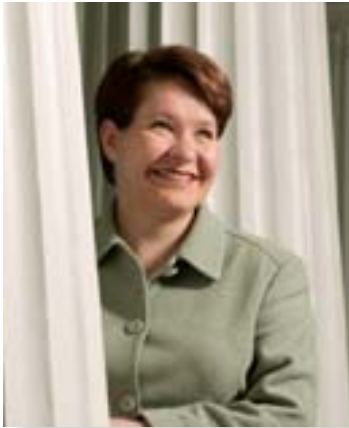
Tarja Filatov Työministeri

Toivotamme kaikille työllisyys-, sosiaali- ja terveyspolitiikan kanssa työskenteleville kollegoille sujuvaa ja tuloksellista yhteistyötä puheenjohtajakautemme aikana. Vain yhdessä voimme saavuttaa hyviä tuloksia koko Euroopan unionin paremman tulevaisuuden hyväksi.