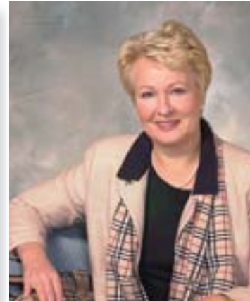
Liisa Hyssälä Peruspalveluministeri