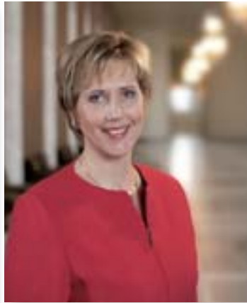
Tuula Haatainen Sosiaali- ja terveysministeri