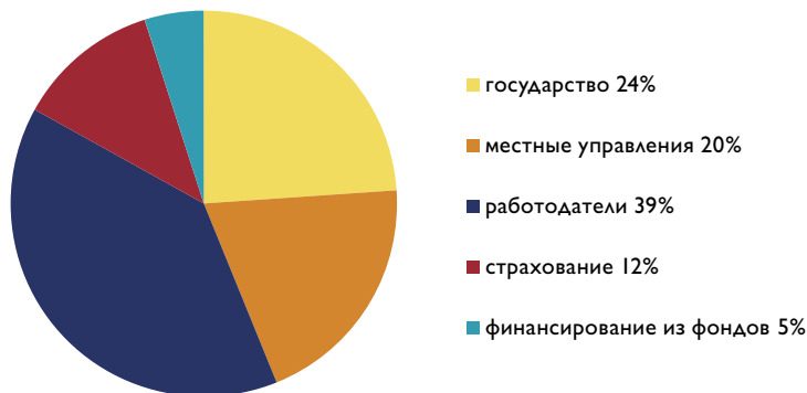
Финансирование социальной защиты в 2005 году

В 2005 году затраты на социальные нужды в Финляндии составили 42 миллиарда евро. Одну треть этой суммы было выделено за счет основных расходных статей бюджета Министерства социального обеспечения и здравоохранения, поскольку социальные расходы также финансируются за счет основных статей государственного бюджета. Социальные затраты составили 27.4 процента от ВВП, что ниже среднего уровня стран ЕС.