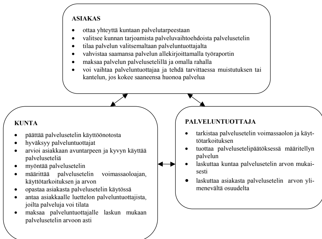
Kuvio 1. Palvelusetelin osapuolet

Olennaista palveluseteliä käytettäessä on asiakkaan valinnanvapaus kunnan hyväksymien palveluntuottajien välillä. Tältä osin toimintamalli poikkeaa kunnan ostopalveluista, jotka yleensä osoitetaan asiakkaan käyttöön ilman asiakkaan omaa vapautta palveluntuottajan valinnassa.