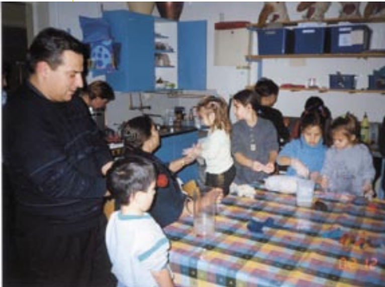
Värillä ei ole väliä -kerho toimii Porissa. Romanilasten varhaiskasvatus ja kerhotoiminta tukevat lapsen kehitystä.