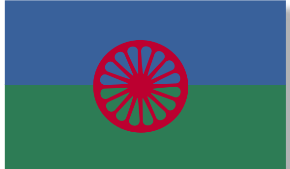
Kaikkien romanien yhteinen lippu ja kansallislaulu "Gelem, Gelem!" hyväksyttiin vuonna 1971 Lontoossa.

Aikaisemmin romanit elivät ns. laajennetussa ydinperheessä kiertelevää elämää viettäen. Isän, äidin ja lasten lisäksi perheeseen kuului isovanhempia ja muita lähiomaisia. Yhteiskuntarakenteen muuttuminen toisen maailmansodan jälkeen muuttanut romaneiden asuolosuhteita.