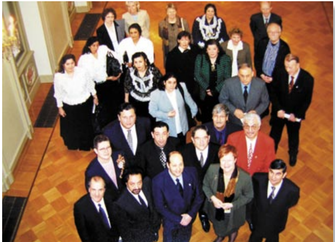
Suomen romanien vahvuutena on yhteistyö valtiovallan kanssa. Romanit tapaamassa presidentti Tarja Halosta v. 2002

Kotimaisten kielten tutkimuskeskuksessa työskentelee tällä hetkellä kaksi romanikielen tutkijaa, joista toinen on romani. Tutkijoiden tehtäviin kuuluvat kielten rakenteen ja sanastoa koskevan tutkimuksen lisäksi kansainvälisen vähemmistökielipolitiikan seuraaminen ja kommentointi. Tutkimuskeskus järjestää vuosittain romanikielen seminaareja yhteistyössä romaniasiain neuvottelukunnan, romaniväestön koulutusyksikön ja romanijärjestöjen kanssa. Tutkimuskeskuksen yhteydessä on toiminut romanikielen lautakunta vuodesta 1997. Lautakunnan tehtävänä on romanikielen kehittäminen, huolto ja tutkimus. ( www.kotus.fi )