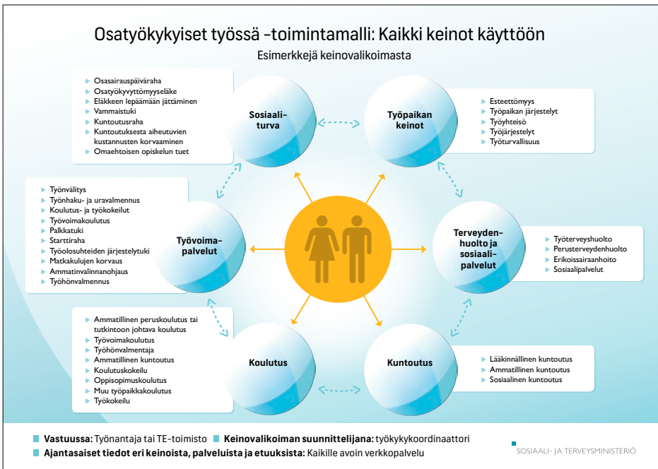
Kuva 2. Osatyökykyiset työssä -toimintamalli

Toimintamalli koostuu työkykykoordinaattorista ja palvelujärjestelmän (palvelut, keinot, etuudet) mahdollisimman tehokkaasta hyödyntämisestä. Työkykykoordinaattori toimii ratkaisukeskeisesti ja hakee yhdessä asiakkaan kanssa työllistymiseen ja työssä jatkamiseen liittyviä ratkaisuja. Toimintamallissa hyödynnetään työpaikan, terveydenhuollon ja sosiaalipalvelujen, kuntoutuksen, koulutuksen, työvoimapalvelujen ja sosiaaliturvan keinoja (Kuva 2). Palveluprosessi toteutuu eri toimintaympäristöissä eri tavoin.