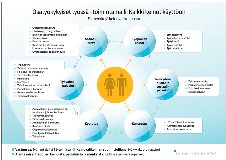
Kuva 2. Osatyökykyiset työssä -ohjelman toimintamalli

keinoista, etuuksista ja palveluista osatyökykyisen henkilön tarpeita vastaavan kokonaisuuden. Ajatuksena oli, että oikeilla toimilla osatyökykyisen työllistymistä ja työssä jatkamista voidaan merkittävästi tukea. Työnantaja tai työ- ja elinkeinotoimisto (TE-toimisto) nimeää työkykykoordinaattorin. On tärkeää, että vastuut koetaan selviksi, sillä muutoin hyvät keinot eivät johda toivottuun tulokseen. Toimintamallissa huomiointiin se, että työllistymisen prosessit ovat erilaisia työssä olevilla ja työhön hakeutuvilla, mutta tavoite on sama: mahdollisuus tehdä työtä. Työkykykoordinaattori tarvitsee työnsä tueksi vahvaa asiantuntijaverkosta sekä ajantasaista tietoa osatyökykyisyyteen liittyvistä palveluista, etuuksista, keinojen vaikuttavuudesta ja tutkimuksesta. Tämän vuoksi toimintamallin käyttöä varten lisättiin verkkopalvelu, joka sisältää ajantasaiset tiedot kaikista keinoista ja niiden yhdistelmien käyttämisestä (Kuva 2).