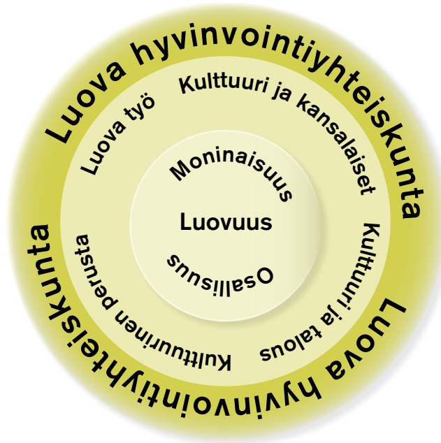
Kulttuuripolitiikan tavoitteet ja vaikuttavuusindikaattorialueet