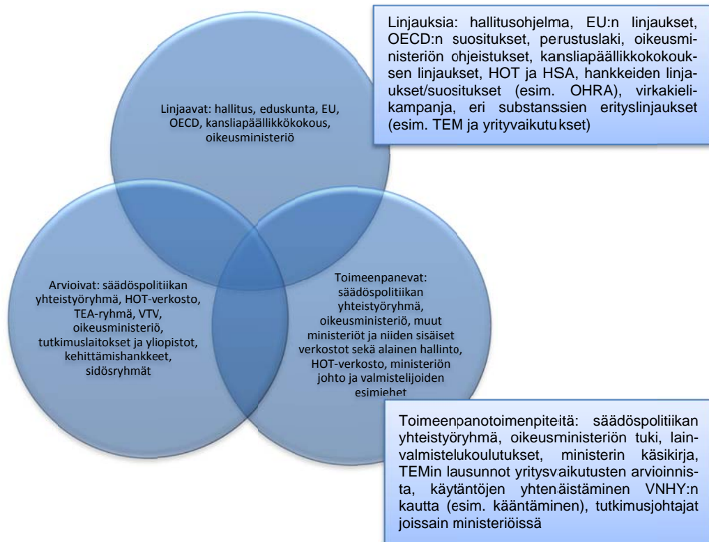
Kuvio 1 Säädöspolitiikan toimijat ja linjaukset