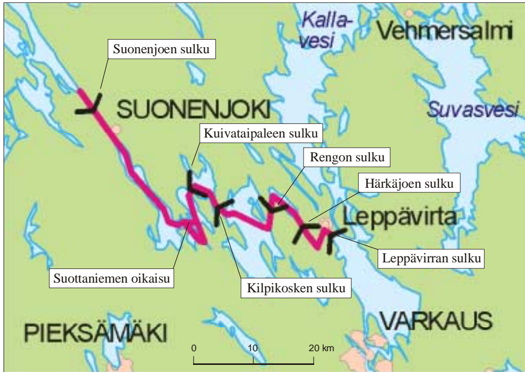
Kuva 1. Päijänne-Saimaa-kanavan suunniteltu linjaus

Suomessa on kaksi suurta pohjois-etelä-suuntaista vesistöaluetta: Vuoksen ja Kymijoen vesistöalue. Niitä erottaa Suonenjoen ja Leppävirran välillä maakannaksista muodostuva osuus, jonka yhteispituus on noin 9 kilometriä. Nk. Päijänne-Saimaa-kanavan rakentamisen tarkoituksena on yhdistää nämä vesistöt toisiinsa yhtenäiseksi, noin 50 000 km 2 :n laajuiseksi vesistöalueeksi, jolla on myös meriyhteys Saimaan kanavan kautta.