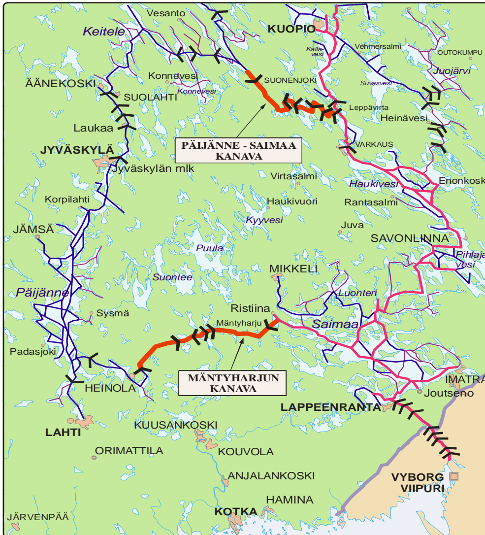
Kuva 2. Vuoksen ja Kymijoen vesistöt ja suunnitelmat niiden yhdistämiseksi