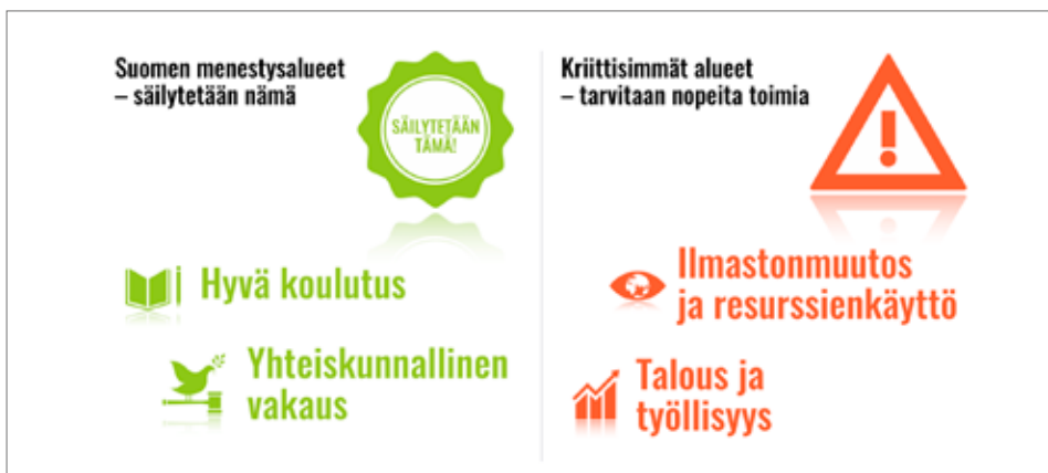
Kuva 2. Avain2030 hankkeen keskeiset johtopäätökset

Suomen lähtötilannetta on arvioitu myös useissa kansainvälisissä tutkimuksissa ja selvityksissä. Tutkimuksia ovat toteuttaneet mm. OECD 5 , Eurostat 6 , Bertelsmann-säätiö 7 sekä Sustainable Development Solutions Network (SDSN) 8 . Nämä tutkimukset ja selvitykset ovat olleet käytössä tätä suunnitelmaa laadittaessa.