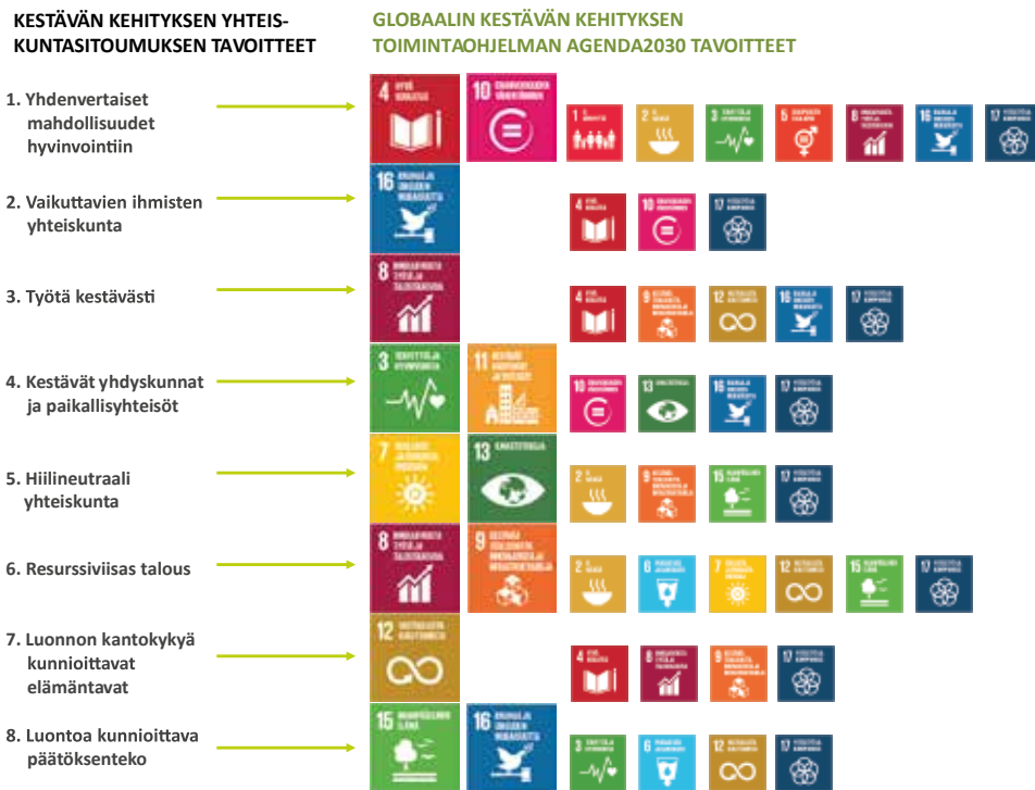
Kuva 3: Yhteiskuntasitoumuksen tavoitteiden ja Agenda2030 tavoitteiden (SDGt) vastavuus