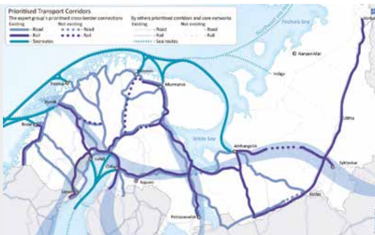
BEATA's Expert Group's prioritized transport network. http://www.barentsinfo.fi/beac/docs/Joint_Barents_Transport_Plan_2013.pdf

Vi oppfordrer regjeringene i Norge, Sverige og Finland og andre som berøres av planlegging av infrastrukturen i nordområdene, til å utforske muligheter for kreativ finansiering. Den nordiske investeringsbank,