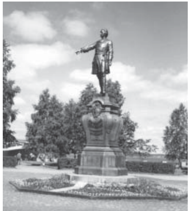
Pietari I:n patsas Petroskoissa.