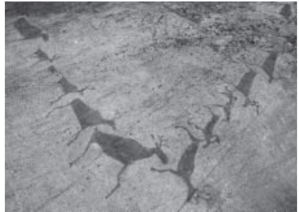
Kalliopiirroksia Belomorskissa.

kulttuurireittien kehittämiseen sekä oppaiden ja henkilökunnankouluttamiseen tähtäävät seminaarit, julkaisujen tuottaminen ja internetaineiston tuottaminen sekä markkinointi. Petroskoin, Kostamuksen, Kemin, Belomorskin, Karhumäen, Aunuksen ja Sortavalan museot yhdessä suomalaisten toimijoiden kanssa valitsevat kulttuurireitin kohteet. Maaliskuussa 2003 hankkeesta on jätetty Tacis- rahoitushakemus, jonka tulos selviää syyskuussa 2003.