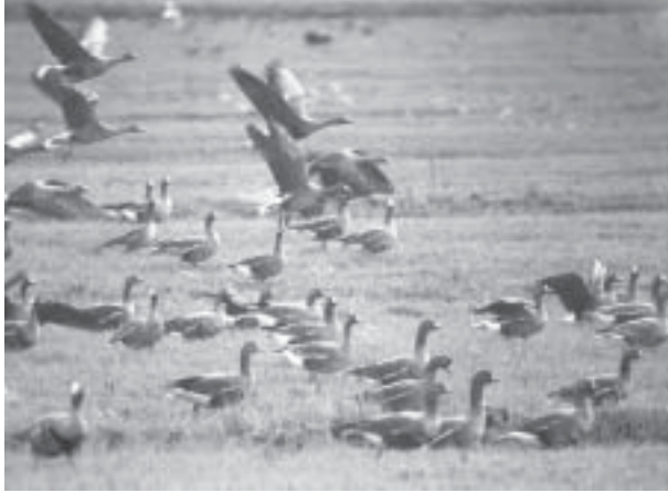
Villihanhia Aunuksen pellolla.