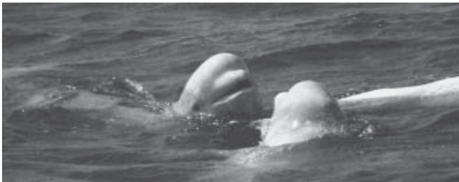
Vienen meren maitovalaita.

Valastarkkailuhanke kohdistuu Vienen meren maitovalaiden tarkkailumatkojen kehittämiseen. Hanke kuuluu osana Solovetskin saaren luonto- ja kulttuuriarvojen säilyttämisprojektiin, jonka kohteina ovat meribiologia, metsäbiologia, Jänissaaren jatulintarhat, luostarin herbaario ja Andrevskin saari. Maitovalaisiin keskittyvä meribiologinen asema pyrkii yhdistämään suojelun lainsäädännöllisin toimenpitein, kestävän luontomatkojen kevyellä infrastruktuurilla sekä luonnontieteellisen tutkimuksen. Valaiden tarkkailumatkat ovat kesällä 2001 lähteneet käyntiin. Valaita voi tarkkailla rannan lintutornista. Saarelle on tarkoitus rakentaa n. 2 km mittainen pitköspuuluontopolku meribiologiselle asemalle. Se mahdollistaa valaiden tarkkailun ilman moottori-käyttöisiä aluksia. Muita valastarkkailun piirissä tapahtuvia toimenpiteitä ovat retkien yhteydessä järjestettävät luennot ja opastukset valaista, eläinten käyttäytymisen kartoitukset. Valaista kertova elokuva julkistettiin keväällä 2003 ja lisäksi on valmistunut valaista kertova kirja "Vienenmeren luostarisaa-ren maitovalaat".