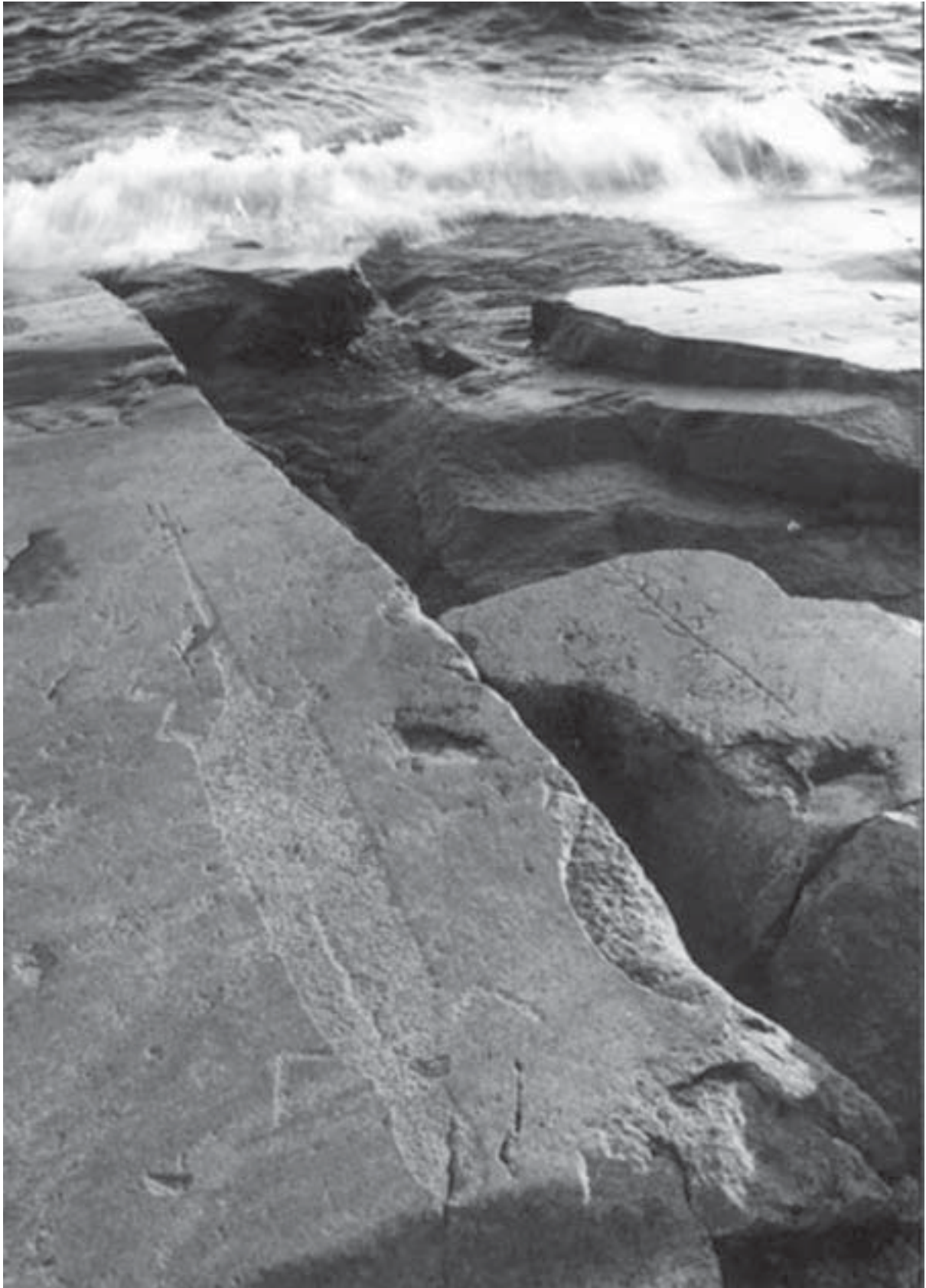
Kalliopirroksia Äänisen rannalla.