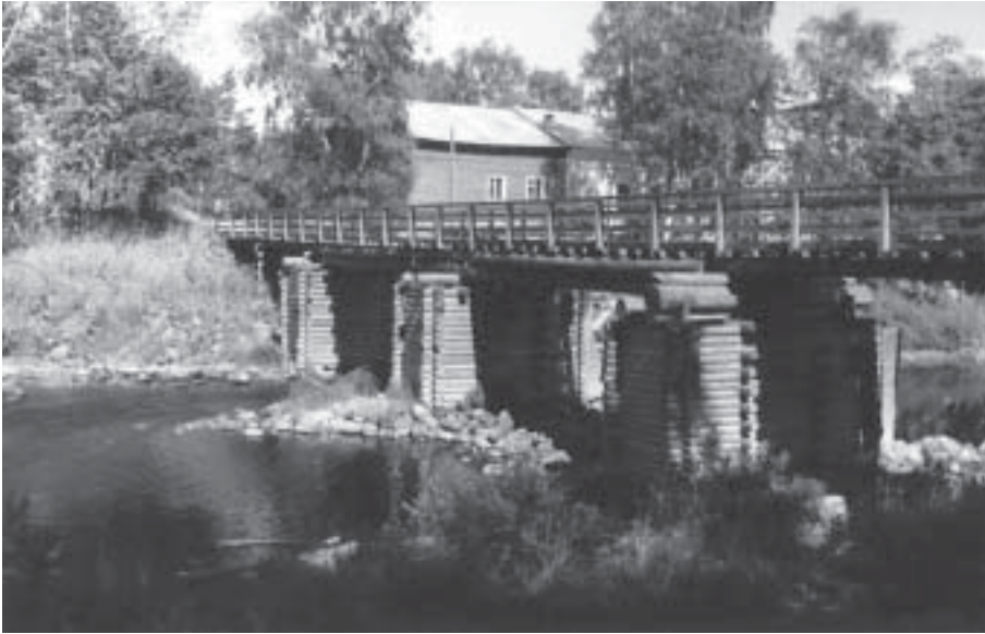
Puusilta Aunuksessa.