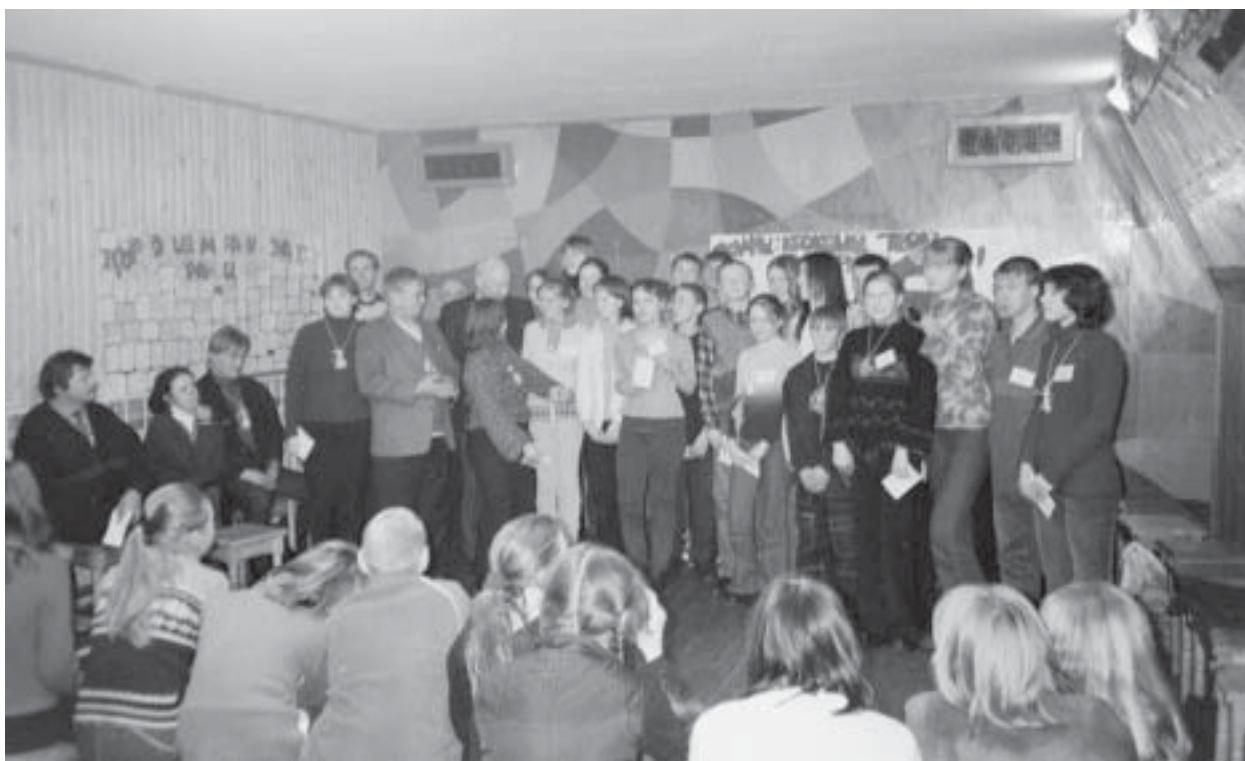
Nuorten Avartti-ohjelman tunnustenjakoilaisuus Särkilahdella tammikuussa 2003.

Karjalan tasavallan opetusministeriön alaisessa nuorten toimintakeskuksessa Petroskoissa on aloitettu nuorten työpajatoiminta vuonna 2001. Tavoitteena on muodostaa toimintakeskuksesta laaja-alainen nuorisopalveluiden keskus. Hankkeeseen ovat sitoutuneet Karjalan tasavallan opetusministeriö ja Karjalan alueellinen yhteiskunnallinen hyväntekeväisyysäätiö sekä Suomesta Nuorten Palvelu ry ja Joensuun nuorisoverstas. Suomen opetusministeriö on tukenut hanketta pienellä starttirahalla. Venäjän federaation työ- ja sosiaaliministeriö on myös lupautunut osallistumaan nuorten työpajan kustannuksiin. Lisäksi toimintakeskus on tarkoitus sitoa osaksi laajempaa ennaltaehkäisevän päihdetyön Tacis-hanketta. Hankkeen koordinaattorina on myös Venäjän federaation virkamiesakatemia Karjalan filiaali.