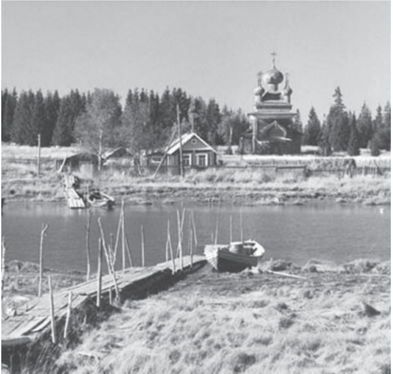
Pietari-Paavalin kirkko Virman kylässä Belomorskin alueella.