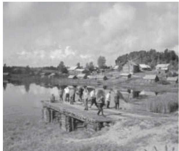
Sotahistoriallisen Seuran vuoden 2002 syysretkellä olijat kuvaamassa Nurmoilan kylää Aunuksessa.