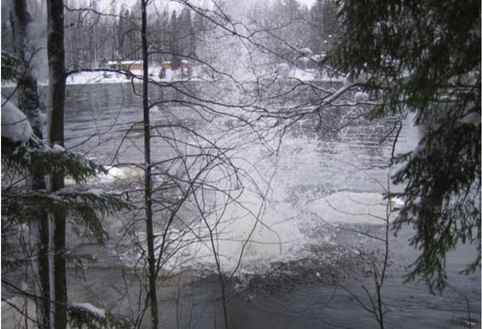
Bild 3. Sprängning av en stöpispropp.

sprängningsarbete, fränsett ringa sprängningsarbete, minst sju dygn innan arbetet påbörjas. /24/