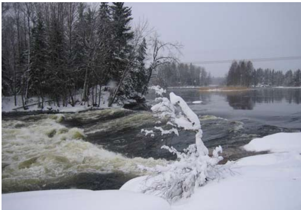
Bild 1. Stöpispropp.

Med en stöpispropp avses stöpismassa som uppstår av underkyllt vatten som bildas när vattnet fryser till. När massan fastnar i bottenstenarna i fårans grunda delar börjar vattnet strömma långsammare och fåran täpps delvis eller helt och hållet till (bild 1).