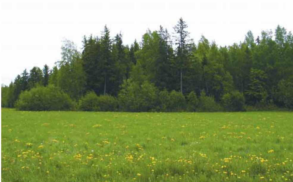
Kuva 10. Monimuotoisen metsänreunan luomiseen ja säilyttämiseen voi saada maatalouden ympäristötukea.

Maisema-aluehankkeen puitteissa yritettiin alueen metsille aloittaa niin kutsuttu luonnonhoitohanke , jossa maiseman huomioonottavia metsätaloussuunnitelmia olisi laadittu ilmaiseksi kaikille hankkeeseen osallistuville metsänomistajille. Tällä hetkellä hankkeelle ei kuitenkaan löytynyt tarpeeksi kiinnostusta, mutta luonnonhoitohankkeen toteuttamisen mahdollisuus on edelleen voimassa, ja mikäli kiinnostusta löytyy tulevaisuudessa, metsänomistaja voi ottaa yhteyttä metsäkeskukseen (taulukko 1). Luonnonhoitohankkeet voivat olla erilaisia, mutta ne kaikki koskevat metsien luonnon- ja maisemanhoidon edistämistä. Näiden hankkeiden kautta yksittäiset metsänomistajat eivät voi saada rahallista tukea, vaan tuki muodostuu työn suorittamisesta, suunnitelmien laatimisesta sekä neuvonnasta. Hankkeiden puitteis-