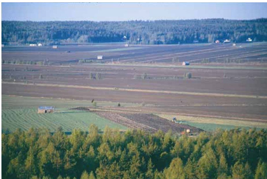
Kuva 9. Söderfjärdeniä ympäröivä metsäreuna kehystää maiseman ja on siksi maisemallisesti tärkeä.

Metsätalouden kaavamääräykset koskevat Öjbergetin yleiskaavoitettua aluetta. MUI-tunnuksella (ympäristöllisesti arvokas metsätalousalue) kaavaan merkityillä alueilla 1 hehtaaria suuremmat uudistushakkuualueet ovat kiellettyjä. Samalla edellytetään, että avohakkuualueille istutetaan välittömästi alueelle tyypillisiä puulajeja. Hakkuiden on myötältävä maaston muotoja ja muutenkin säilytettävä luonnon ominaispiirteitä. Mäen laki on merkitty tunnuksella SL luonnonsuojelualueeksi. Siellä ei sallita muita metsätaloustoimenpiteitä, kuin puiden kaataminen yksityisten asuntojen kotitalouskäyttöön.