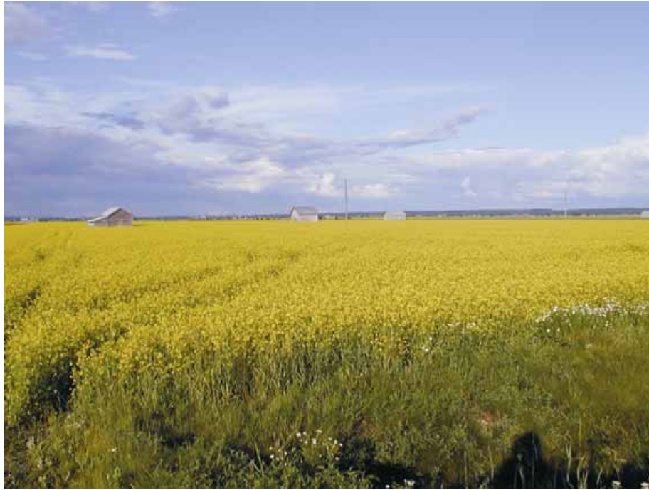
Kuva 5. Söderfjärdenin vaikuttavalla viljelylakeudella on edelleen muutamia latoja ja riisiä.

määräyksiä maiseman- ja luonnon huomioimisesta hakkuiden yhteydessä (MU).