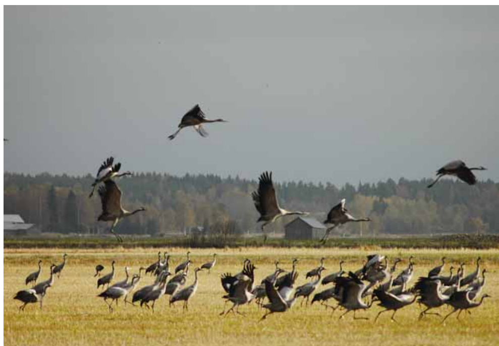
Kuva 4. Muuttavia kurkia Söderfjärdenillä.

Söderfjärdenillä oleskelevien kurkien määrä houkuttelee syksyisin myös ihmisiä. Paikalliset lintutieteelliset yhdistykset järjestävät keväisin ja syksyisin retkiä Söderfjärdenille. Viljelyaukealla ja etenkin pumppausasemalla ja näkötorussa käy kesäisin sekä yksittäisiä kävijöitä että opastettuja ryhmiä. Kävijämäärä aiheuttaa etenkin keväisin ja syksyisin ongelmia työkoneiden eteen pysäköityjen autojen muodossa. Söderfjärdenin keskelle Marenintien varteen Sundomin jakokunnan omistamalle alueelle on siksi tehty pieni parkkipaikka. Sundomin kyläyhdistys (bygdeförning) tulee siirtämään alueelle vanhan riihen, johon perustetaan Söderfjärdenistä kertova näyttely, tähtitieteellinen observatorio sekä kahvila. Läheisyyteen rakennetaan myös uusi lintutorni.