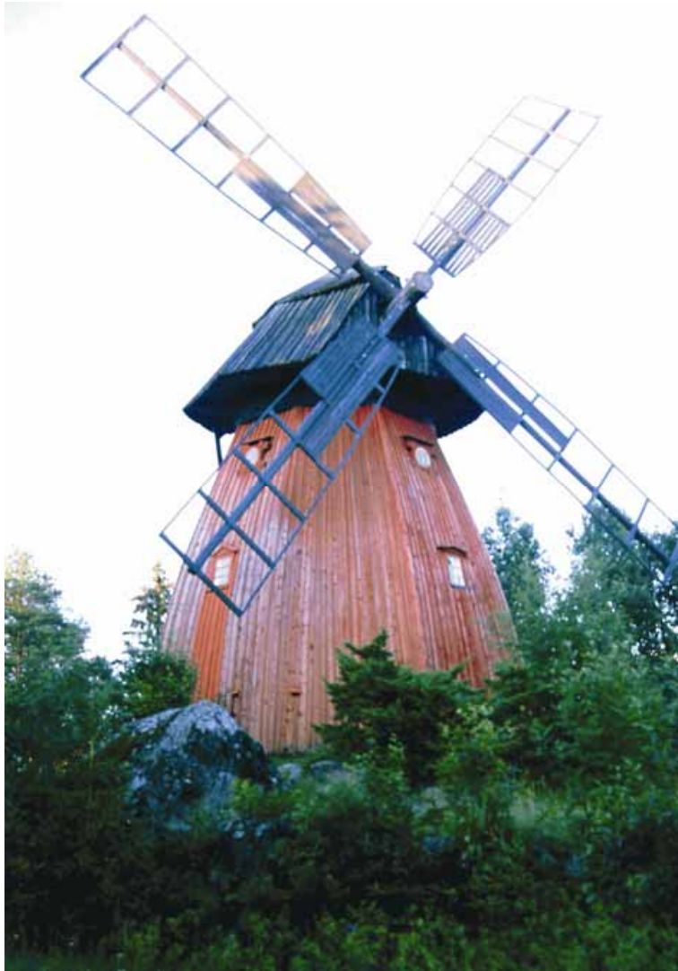
Kuva 6. Södersundin mamsellityyppinen tuulimylly on yksi rakennushistoriallisesti arvokkaimista kohteista, jotka ovat ominaisia maisemassa.