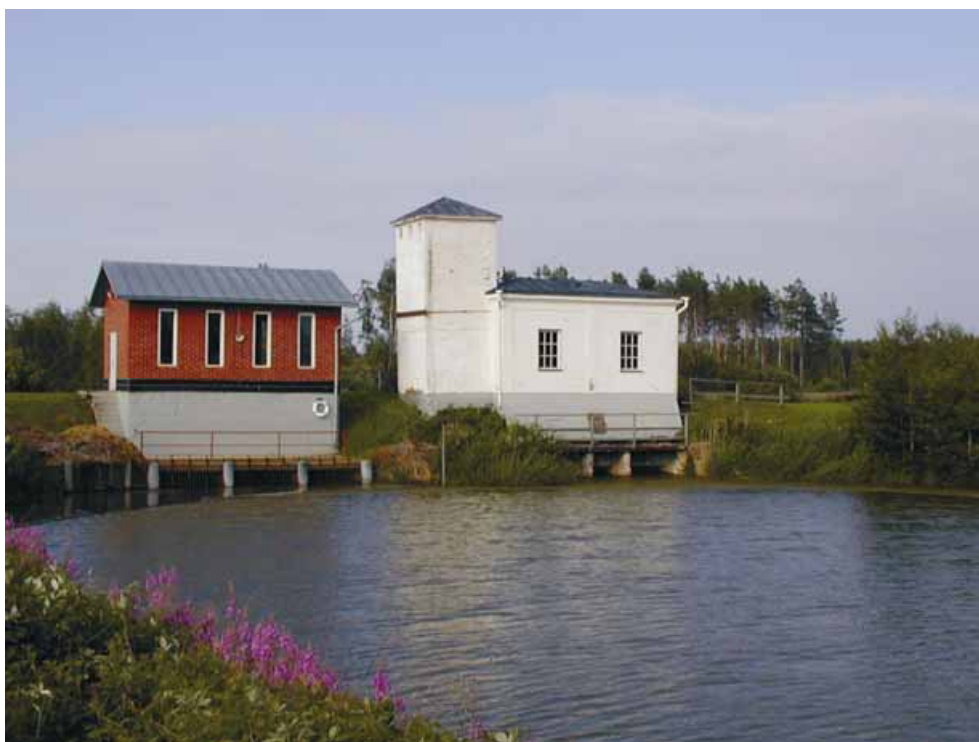
Kuva 2. Oikealla oleva vanha pumppaamo toimii nykyään museona.

1990-luvun keskivaiheilla aloitettiin yhteinen salaojien järjestely. Sen ansiosta happamuutta voidaan kontrolloida, mikä maataloudellisen hyödyn lisäksi vaikuttaa myös veden laskupaikan eli Eteläisen kaupunginselän vedenlaatuun. Tämän järjestelyn laajuus on myös eurooppalaisessa mittakaavassa ainutlaatuinen, esimerkiksi hankkeen yhteydessä alueelle sijoitettiin yli 500 säätösalaojakaivoa.