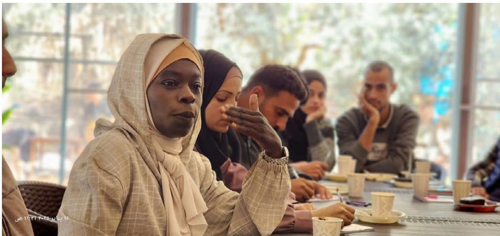
Bild 11. I januari 2025 diskuterade palestinska ungdomar i Gaza metoder för att dämpa spänningarna i samhället och främja sammanhållningen. Workshoppen var en del av en mer omfattande serie workshoppar som ordnades av CMI – Martti Ahtisaari Peace Foundation, där man kartlade de ungas roll för att främja social samhörighet.

den 1 januari 2023 och stärker varje persons sexuella självbestämmanderätt och skyddet av den personliga integriteten. Det centrala är i synnerhet den så kallade samtyckesgrunden och den växande mångfalden av sexuellt ofredande, vilket har lett till en utvidgning av rekvisitet för sexuellt ofredande. Myndigheternas kapacitet bör utvecklas så att offren får bästa möjliga stöd och så att straffprocesserna blir snabbare. Det är viktigt att tröskeln för att göra en brottsanmälan sänks och att offret vid behov erbjuds skydd mot gärningsmannen.