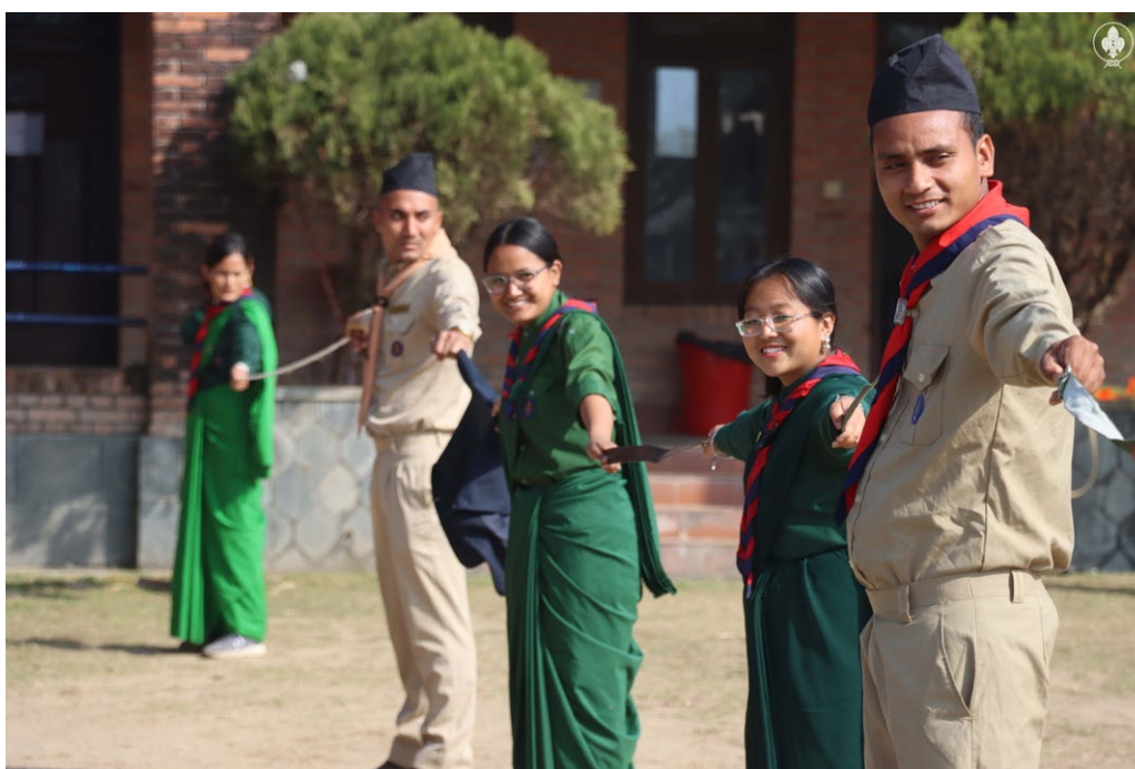
Bild 13. Scouts, Peace and Security är ett gemensamt utvecklingsprojekt för Nepals och Finlands scouter som fokuserar på fredsfostran, på att förbättra ungas möjligheter att påverka och främja social fred. Resolution 2250 utgör grunden för arbetet. Inom projektet ordnas diskussionstillfällen där nepalesiska unga kan föra en dialog med lokala beslutsfattare. Projektet Scouts, Peace and Security genomförs med finansiering från utrikesministeriet 2023–2025.

Partnerskapet med det civila samhället och de unga syns också i att de unga blir en del av Finlands utrikes- och säkerhetspolitik. I genomförandet av Agenda 2030 har de unga en central roll. Gruppen De ungas Agenda 2030, som grundades under Finlands kommission för hållbar utveckling under ledning av statsministern 2017, deltar i främjandet av målen för hållbar utveckling på olika håll i Finland. Klimat- och naturgruppen för unga (Nuoli) som grundades 2023 hjälper ministerierna i planeringen, genomförandet och konsekvensbedömningen av ungas deltagande. De ungas och organisationernas 2250-nätverk är en viktig partner i utrikes- och säkerhetspolitiken.