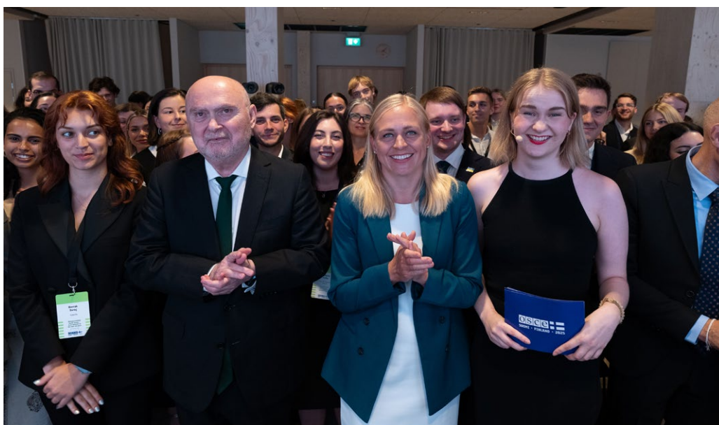
Bild 2. Finland organiserade ett ungdomsforum i Helsingfors under sitt ordförandeskap i OSSE år 2025. Till forumet deltog 130 unga från 51 länder.

Europeiska unionens betydelse för 2250-arbetet har ökat under de senaste åren. År 2018 publicerade EU en ungdomsstrategi och mål för 2019–2027 och godkände rådets slutsatser om den år 2018 och 2021 3 . EU:s första ungdomshandlingsplan (2022–2027) 4 har som syfte att beakta unga mer konsekvent än tidigare i EU:s yttre åtgärder. EU:s Youth Sounding Board , som EU-kommissionär Jutta Urpilainen inledde 2021, fungerar som rådgivande expertgrupp för kommissionen och generaldirektoratet för internationella partnerskap (DG INTPA). Kommissionens solidaritetskår stöder de ungas samhällliga deltagande och biståndsarbete. EU-finansiering kanaliseras också via initiativen Global Gateway. EU och Finland stöder lokala projekt som förebygger våldsamt radikaliserande av unga och deras deltagande i terroristgruppers verksamhet. 5 År 2023 publicerade EU:s utrikestjänst ett minikoncept för genomförandet av 2250-agendan i civila krisanteringsoperationer som lyder under EU:s gemensamma säkerhets- och försvarspolitik (GSFP). 6