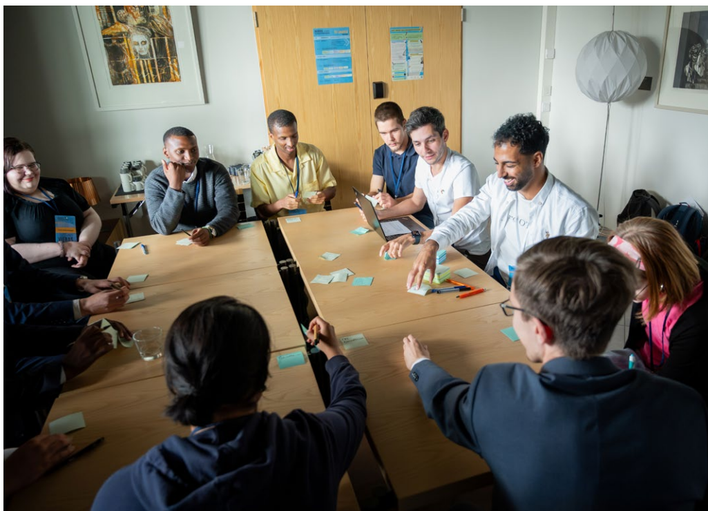
Bild 9. Unga diskuterade framtida generationers rättigheter och ungas delaktighet i FN vid Framtidstoppmötet för unga den 24–25 augusti 2024.

Våld bland unga är ett växande problem. Största delen av de unga i Finland begår inga brott, men brott bland barn under 15 år, i synnerhet våldsbrott, har ökat betydligt under de senaste åren. Det är viktigt att ingripa i tid mot hotbilder såsom bildandet av gatugäng. Samarbetet mellan polisen och de sociala myndigheterna måste intensifieras ytterligare. Man måste i synnerhet ta ungas våldsamt och känsla av otrygghet på allvar. De ungas egen expertis på området ska identifieras och utnyttjas för att motarbeta våldet. I redogörelsen för den inre säkerheten som är under beredning beaktas behovet av ett multiprofessionellt grepp för att förebygga att unga hamnar i kriminell verksamhet eller gatugäng. Dessutom genomför statsrådet och myndigheterna ett omfattande åtgärdsprogram för att förebygga och bekämpa den ökade ungdoms- och gängbrottsligheten i Finland. Även i EU:s strategi för den inre säkerheten som är under beredning beaktas bekämpningen av hot mot barn och unga.