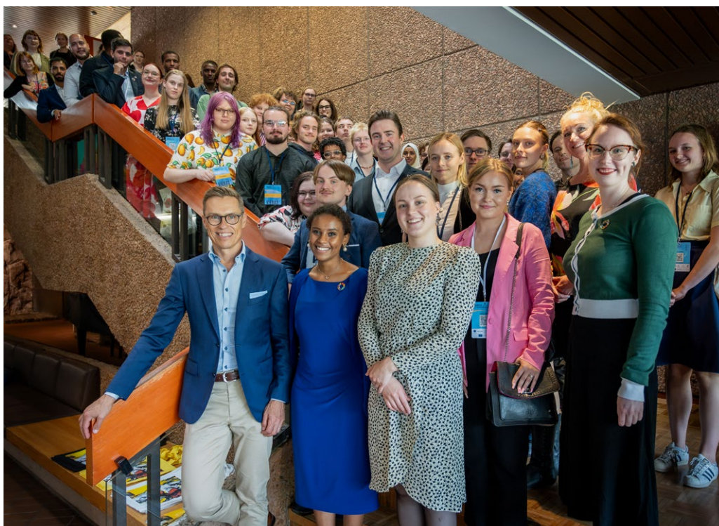
Bild 1. Ungdomsdelegaterna i FN och Finlands FN-ungdom ordnade ett Framtidstoppmöte för unga i Hanaholmens kulturcentrum i Esbo den 24–25 augusti 2024. Republikens president Alexander Stubb deltog också i evenemanget.

Finlands utrikes- och säkerhetspolitik grundar sig på värdebaserad realism. Dess mål är att trygga Finlands självständighet och territoriella integritet, förhindra att Finland hamnar i en militär konflikt och garantera finländarnas säkerhet och välfärd. Grunden för verksamheten är demokrati, rättsstatsprincipen, mänskliga rättigheter, jämställdhet och likvärdighet. Grunden för vår utrikes- och säkerhetspolitik utgörs av rättsstatsprincipen, de mänskliga rättigheterna, jämlikhet och demokrati. Handlingsplanen främjar genomförandet av dessa. Begreppen fred och säkerhet förstås i bred bemärkelse i handlingsplanen. När man talar om fred och säkerhet beaktar man utöver konflikter och fredsprocesser även åtgärder som främjar stabilitet, välfärd och kriställighet i samhället. Unga kan delta i fredsprocesserna på olika nivåer. Verksamheten kan till exempel bestå av fredsarbete som uppstår på de ungas eget initiativ eller av statligt stödd ungdomsverksamhet för att främja fred. Till exempel lika tillgång till utbildning, ekonomisk stabilitet samt psykiskt och fysiskt välbefinnande förebygger konflikter, främjar stabilitet och social kohesion i samhället. Ungas yttrandefrihet och handlingsfrihet måste garanteras, och de behöver skyddas mot trakasserier och våld.