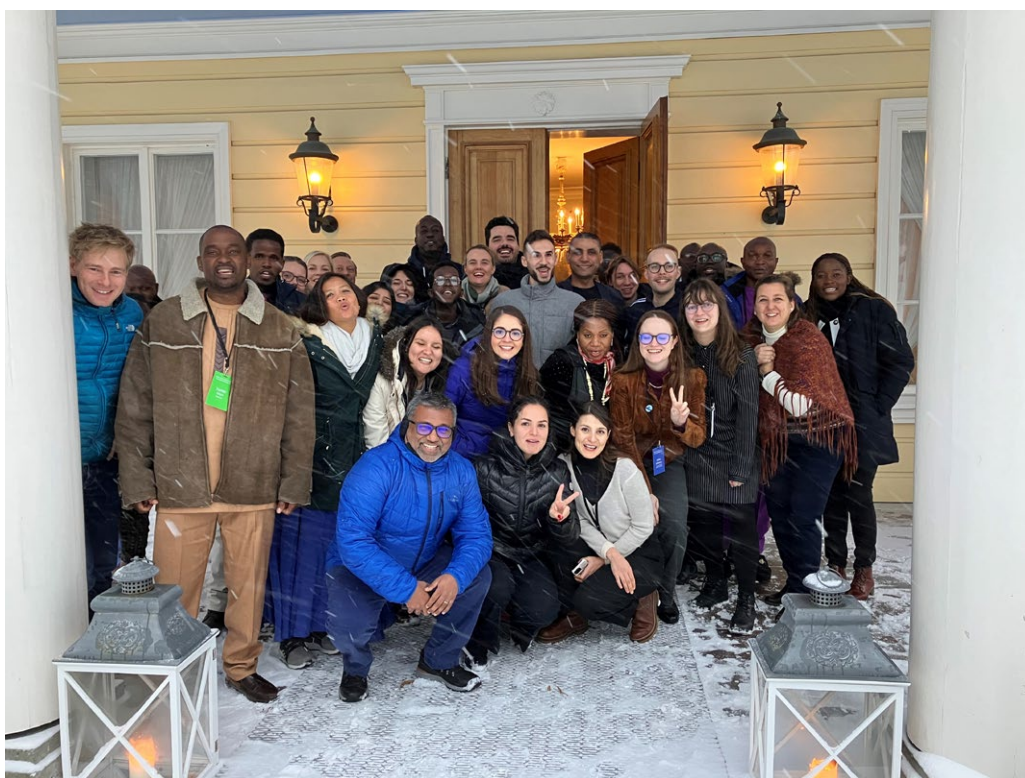
Bild 12. Workshopen Unga, fred och säkerhet, som ordnades av Finland, förde samman unga och tjänstemän från olika länder.

Finland betonar betydelsen av mångsidiga partnerskap för att uppnå fred och utveckling. Samarbetet mellan olika intressentgrupper är centralt för att förebygga konflikter, upprätthålla freden samt stärka demokratin och det regelbaserade internationella systemet. Mångsidiga partnerskap är styrkor som är typiska för Finland och detta utnyttjas också i verkställandet av 2250-agendan. På nationell nivå är de mest betydande aktörerna och samarbetspartnerna ministerierna och ämbetsverken, det akademiska samfundet och frivilligorganisationerna, i synnerhet ungdomsorganisationerna. Samarbetspartner kan också vara näringslivet, som ger unga sysselsättningsmöjligheter samt en fackföreningsrörelse som har kompetens om unga arbetstagares rättigheter och arbetshälsa. Riksdagen har sedan perioden 2019–2023 haft aktionsgruppen Unga, fred och säkerhet, som blev officiell hösten 2024. Gruppens mål är att öka kännedomen om agendan i riksdagen och stärka samarbetet mellan det civila samhället och de politiska beslutsfattarna.