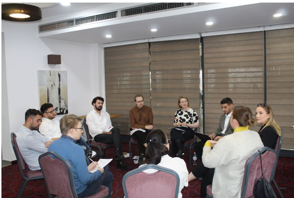
Bild 8. Flerpartialog mellan finländska och kosovanska ungdomar som en del av planeringen av ett projekt som ordnades av Demo Finland och Prishtina Institute for Political Studies (PIPS) för att stödja ungas politiska deltagande i Kosovo.

Finlands säkerhet bygger på ett stabilt samhälle där unga inte lämnas utanför, utan är en del av samhället. Det är viktigt att unga deltar i arbetet med att motverka marginalisering, våld och otrygghet. Det förebyggande arbetet måste prioritera konkreta åtgärder som motverkar marginalisering, stärker de ungas psykiska uthållighet och bekämpar våldsamt beteende och brottslighet.