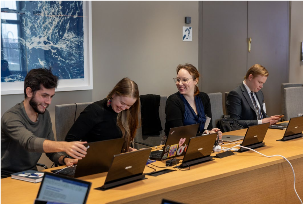
Bild 7. Finlands andra handlingsplan om Unga, fred och säkerhet bereddes i samarbete mellan de unga och myndigheterna. Bilden är från valideringstillfället som hölls vid utrikesministeriet den 13 mars 2025.

En förutsättning för ett meningsfullt deltagande är att alla unga har möjlighet att delta inte bara i de beslut som gäller dem utan också i planeringen, genomförandet och uppföljningen av besluten. Deltagandet ska vara tryggt och tillgängligt för alla unga och tillvägagångssätten ska utvecklas för att nå unga med olika bakgrund. I handlingsplanen kategoriseras de ungas deltagande i två nivåer som påverkar varandra. Dessa nivåer är påverkan och deltagande i det demokratiska beslutsfattandet och fri påverkan till exempel via sociala medier och i form av demonstrationer. Målet är att garantera de ungas rätt att delta tryggt på båda nivåerna utan rädsla för trakasserier eller våld. De ungas möjligheter att delta ska tryggas även i undantags-situationer. För att garantera ett jämlikt deltagande och följa regeringens jämställdhetsprogram utreds jämställdhetsproblem som drabbar män och pojkar samt deras koppling till marginaliseringen av unga män.