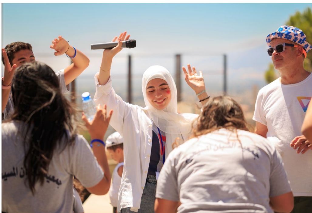
Bild 3. Unga som utexaminerats som omsorgsassistenter från en yrkesutbildning vid YMCA i Libanon på examensfest i Ksara, Bekaadalen. Libanon 2023.

Av de internationella frivilligorganisationerna är det i synnerhet United Network of Young Peacebuilders (UNOY), Search for Common Ground (SfCG), Interpeace, Global Partnership for the Prevention of Armed Conflict (GPPAC) och Global Coalition on Youth, Peace and Security (GCYPS) som främjar agendan unga, fred och säkerhet i sin verksamhet.