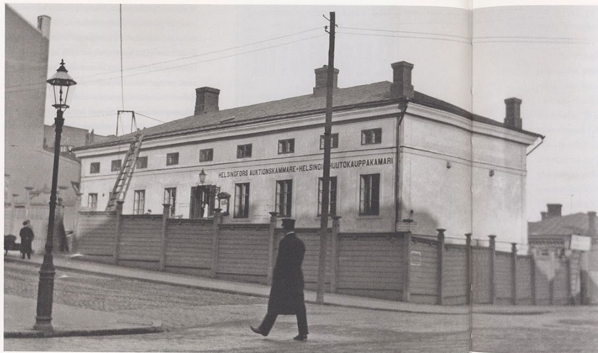
Vanha tulli- ja pakkahuone Aleksanterinkadulta kuvattuna noin vuonna 1900, jolloin rakennuksessa toimi Helsingin huutokauppakamari.