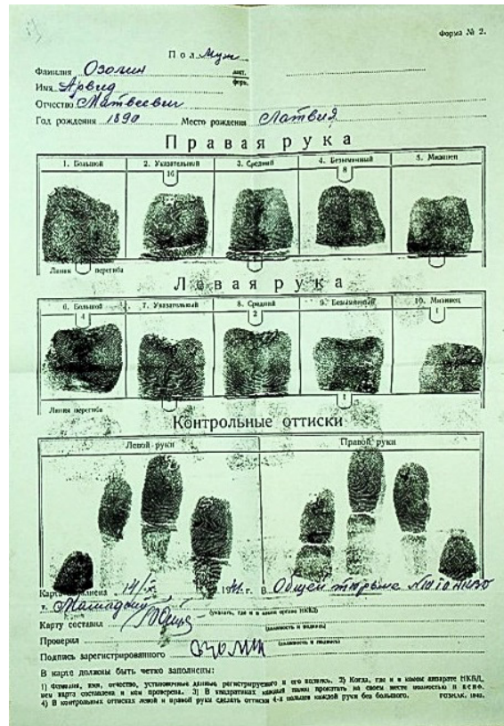
Kuvio 23. NKVD:n tutkintapöytäkirjaan liitetyt sormenjäljet.