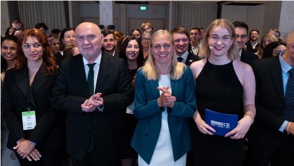
Kuva 2. Suomi järjesti nuorisofoorumin Helsingissä toimiessaan ETYJ-puheenjohtajana vuonna 2025. Foorumiin osallistui 130 nuorta 51 maasta.

Euroopan unionin merkitys 2250-työssä on kasvanut viime vuosina. EU julkaisi vuonna 2018 nuorisostrategian ja tavoitteet vuosille 2019–2027 ja on hyväksynyt sitä koskevat neuvoston päätelmät vuosina 2018 ja 2021 3 . EU:n ensimmäisen nuorisotoimintaohjelma (2022–2027) 4 pyrkii huomioimaan nuoret aiempaa johdonmukaisemmin EU:n ulkosuhdetyössä. EU-komissaari Jutta Urpilaisen vuonna 2021 käynnistämä EU:n Youth Sounding Board toimii neuvoa-antavana asiantuntijaryhmänä komissiolle ja kansainvälisistä kumppanuuksista vastaavalle pääosastolle (DG INTPA). Komission solidaarisuusjoukot tukevat nuorten yhteiskunnallista osallistumista ja avustustyötä. EU:n rahoitusta kanavoidaan myös Global Gateway -aloitteiden kautta. EU ja Suomi tukevat paikallisia hankkeita, jotka ehkäisevät nuorten väkivaltaista radikalisoitumista ja osallistumista terroristiryhmien toimintaan. 5 Vuonna 2023 EU:n ulkosuhdehallinto julkaisi minikonseptin 2250-agendan toimeenpanosta EU:n yhteisen turvallisuus- ja puolustuspolitiikan (YTPP) alaisissa siviilikriisinhallintaoperaatioissa. 6