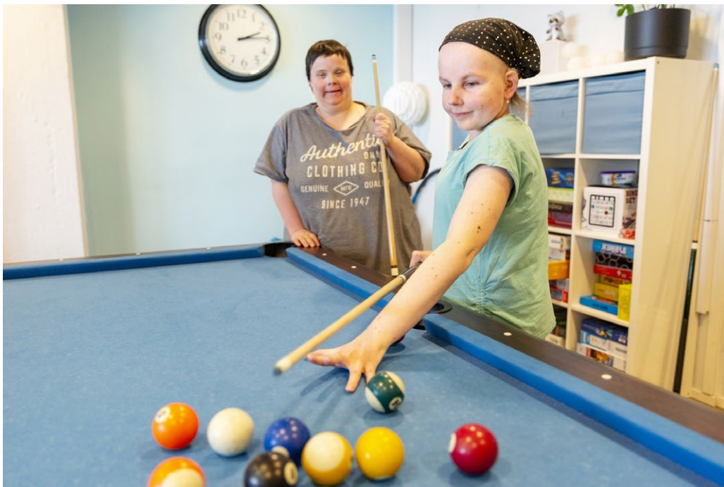
Kuva 6. Vammaisten nuorten osallistumista arjen mielekkääseen toimintaan Suomen setlementtiliikkeessä. Toiminnassa painottuu yhteisöllisyys, yhdenvertaisuus ja osallisuus.

Siitä huolimatta, että jotkut vähemmistöt kokevat enemmän syrjintää, halutaan välttää yksinkertaistusta, jossa jokin ryhmä tai yksilö on yksilotteisesti haavoittuvainen. Usein yksilöön kohdistuu moniperusteista syrjintää, ja esimerkiksi etniseen vähemmistöön kuuluvan naisen asema saattaa olla valtaväestöön kuuluvaa naista heikompi.