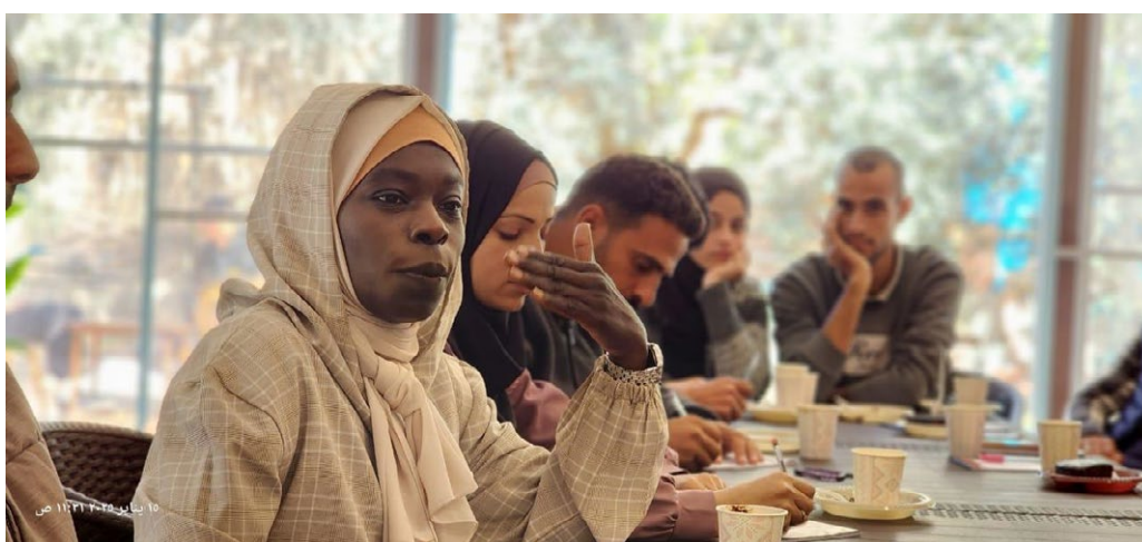
Kuva 11. Palestiinalaiset nuoret keskustelivat Gazassa tammikuussa 2025 keinoista lievittää yhteisön sisäisiä jännitteitä ja edistää yhteenkuuluvuutta. Työpaja oli osa laajempaa CMI – Martti Ahtisaari Peace Foundationin järjestämää työpajasarjaa, jossa kartoitettiin nuorten roolia sosiaalisen yhteenkuuluvuuden edistämiseksi.

tuli voimaan 1.1.2023 ja se vahvistaa jokaisen seksuaalista itsemääräämisoikeutta ja henkilökohtaisen koskemattomuuden suojaa. Keskeistä on etenkin ns. suostumusperusteisuus sekä seksuaalisen ahdistelun monimuotoistuminen, jonka myötä seksuaalisen ahdistelun tunnusmerkistön laajentuminen. Viranomaisten kapasiteettia tulee kehittää, jotta uhrin saavat parhaan mahdollisen tuen ja että rikosprosessit nopeutuvat. On tärkeää, että kynnystä rikosilmoituksen tekemiseen madalletaan ja että uhrille tarjotaan tarvittaessa suojelua tekijältä.