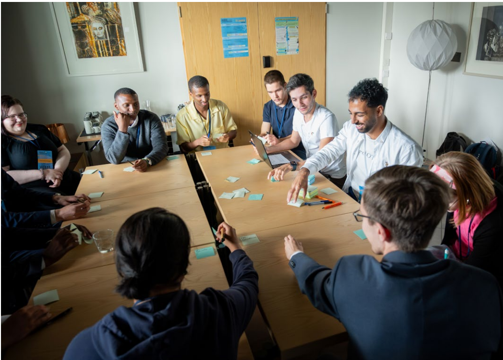
Kuva 9. Nuoret keskustelivat tulevien sukupolvien oikeuksista ja nuorten osallisuudesta YK:ssa Nuorten Tulevaisuushuippukokouksessa 24.–25.8.2024.

Nuorten väkivalta on kasvava ongelma. Suurin osa nuorista Suomessa ei tee rikoksia mutta alle 15-vuotiaiden rikokset, erityisesti väkivaltarikokset, ovat lisääntyneet merkittävästi viime vuosina. Katujengien muodostumisen kaltaisiin uhkakuviiin on tärkeä puuttua ajoissa. Poliisin ja sosiaaliviranomaisten yhteistyötä on tiivistettävä entisestään. Erityisesti nuorten väkivaltaisuuden ja turvattomuuden tunteeseen on suhtauduttava vakavasti. Nuorten oma asiantuntemus aiheesta tulee tunnistaa ja sitä tulee hyödyntää väkivallan kitkemisessä. Valmistella olevassa sisäisen turvallisuuden selonteossa huomioidaan tarve moniammatilliseen otteeseen, jotta nuorten ajautumista rikolliseen toimintaan tai katujengeihin voidaan ennaltaehkäistä. Lisäksi valtioneuvosto ja viranomaiset toteuttavat laajaa toimenpideohjelman, jolla ehkäistään ja torjutaan nuoriso- ja jengirikollisuuden lisääntymistä Suomessa. Myös valmisteilla olevassa EU:n sisäisen turvallisuuden strategiassa huomioidaan lapsiin ja nuoriin kohdistuvien uhkien torjunta.