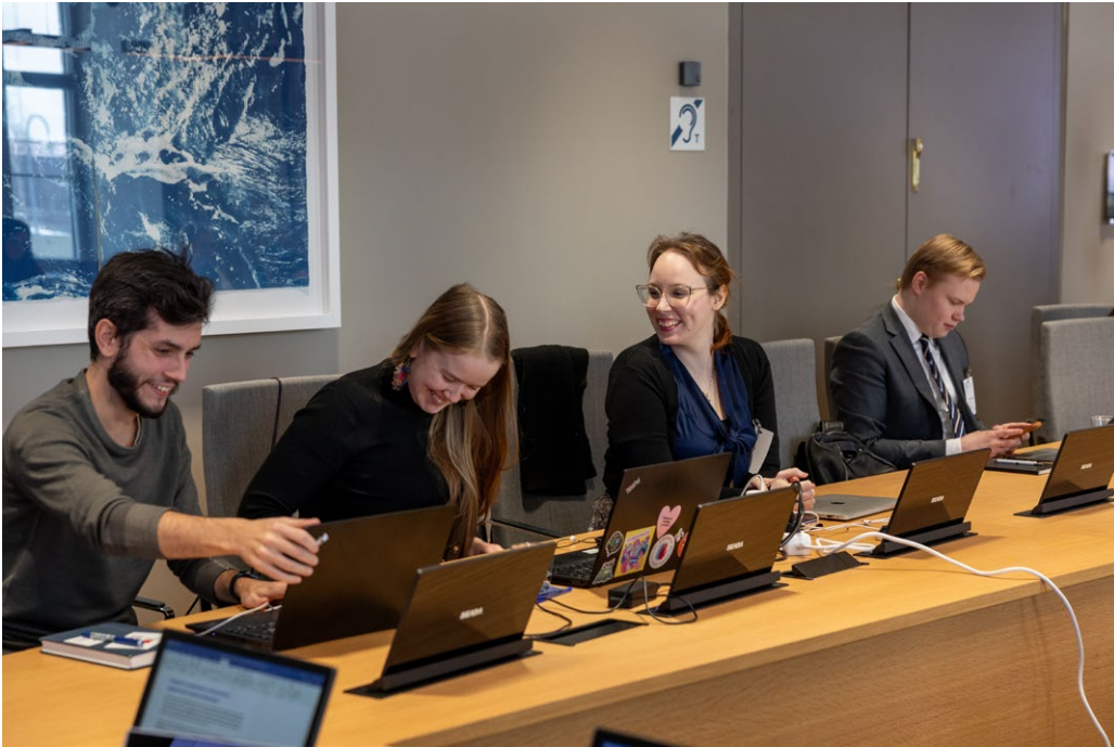
Kuva 7. Suomen toista Nuoret, rauha ja turvallisuus -toimintaohjelmaa valmisteltiin nuorten ja viranomaisten yhteistyönä. Kuva ulkoministeriössä 13.3.2025 pidetystä validointitilaisuudesta.

Merkityksellinen osallistuminen edellyttää, että kaikilla nuorilla on mahdollisuus osallistua paitsi heitä koskevien päätösten tekoon, myös niiden suunnitteluun, toimeenpanoon ja seurantaan. Osallistumisen tulee olla turvallista ja saavutettavaa kaikille nuorille, ja toimintatapoja on kehitettävä eritaustaisten nuorten tavoittamiseksi. Toimintaohjelmassa nuorten osallistumisen nähdään toimivan kahdella, toisiinsa vaikuttavalla tasolla. Nämä ovat vaikuttaminen ja osallistuminen demokraattiseen päätöksentekoon sekä vapaamuotoinen vaikuttaminen esimerkiksi sosiaalisen median ja mielenosoitusten kautta. Tavoitteena on taata nuorten oikeus turvalliseen osallistumiseen molemmilla tasoilla ilman pelkoa häirinnästä tai väkivallasta. Nuorten osallistumismahdollisuudet on turvattava myös poikkeustilanteissa. Tasa-arvoisen osallistumisen takaamiseksi ja hallituksen tasa-arvo-ohjelman mukaisesti selvitetään miehiin ja poikiin kohdistuvia tasa-arvo-ongelmia sekä niiden yhteyttä nuorten miesten syrjäytymiseen.