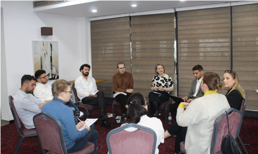
Kuva 8. Monipuoluedialogia suomalaisten ja kosovolaisten nuorten välillä osana Demo Finlandin ja Prishtina Institute for Political Studiesien (PIPS) hankesuunnittelua, jonka pohjalta käynnistettiin nuorten poliittista osallistumista Kosovossa tukeva hanke.

Suomen turvallisuus rakentuu vakaalle yhteiskunnalle, jossa nuoret eivät jää ulkopuolelle, vaan ovat osa yhteiskuntaa. Nuorten osallisuus syrjäytymisen, väkivallan ja turvattomuuden torjunnassa on keskeistä. Ennaltaehkäisyn painopiste on suunnattava konkreettisiin toimiin, jotka estävät syrjäytymistä, vahvistavat nuorten henkistä kestävyttä sekä torjuvat väkivaltaista käyttäytymistä ja rikollisuutta.