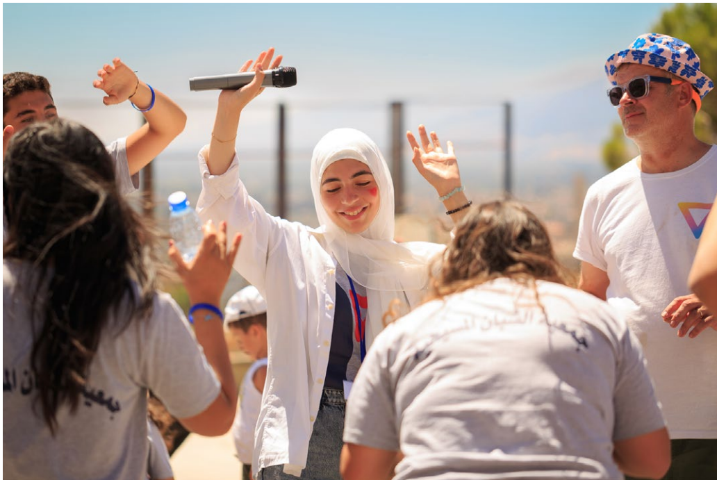
Kuva 3. Libanonin YMCA:n ammattikoulutuksesta hoiva-avustajiksi valmistuneita nuoria valmistujaisjuhlassa, Ksarassa, Bekaan laaksossa. Libanon 2023.

Kansainvälisistä kansalaisjärjestöistä erityisesti United Network of Young Peacebuilders (UNOY), Search for Common Ground (SfCG), Interpeace, Global Partnership for the Prevention of Armed Conflict (GPPAC), sekä Global Coalition on Youth, Peace and Security (GCYPS) edistävät Nuoret, rauha ja turvallisuus -agenda toiminnassaan.