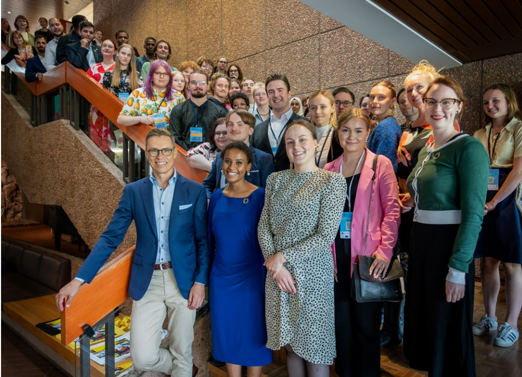
Kuva 1. Nuorten YK-delegaattit ja Suomen YK-nuoret järjestivät Nuorten Tulevaisuus-huippukokouksen Espoossa Hanasaaren kulttuurikeskuksessa 24.–25.8.2024. Myös Suomen tasavallan presidentti Alexander Stubb vieraili tapahtumassa.

Suomen ulko- ja turvallisuuspolitiikka pohjautuu arvopohjaiseen realismiin. Sen päämääränä on turvata Suomen itsenäisyys ja alueellinen koskemattomuus, estää Suomen joutuminen sotilaalliseen konfliktiin ja taata suomalaisten turvallisuus ja hyvinvointi. Toiminnan perustana ovat demokratia, oikeusvaltioperiaate, ihmisoikeudet, tasa-arvo ja yhdenvertaisuus. Ulko- ja turvallisuuspolitiikkamme perustan luovat oikeusvaltioperiaate, ihmisoikeudet, tasa-arvo sekä demokratia. Toimintaohjelma edistää näiden toteutumista. Rauhan ja turvallisuuden käsitteet ymmärretään toimintaohjelmassa laajassa merkityksessä. Rauhasta ja turvallisuudesta puhuttaessa huomioidaan konfliktien ja rauhanprosessien lisäksi myös yhteiskuntien vakautta, hyvinvointia ja kriisinsietokykyä edistävät toimet. Nuorten osallistuminen rauhanprosesseihin voi olla eri tasoilla tapahtuvaa toimintaa. Se voi olla esimerkiksi nuorten omasta aloitteesta syntyvää rauhantyötä, tai valtion tukemaa nuorille ohjattua toimintaa rauhan edistämiseksi. Esimerkiksi yhdenvertainen koulutuksen saavutettavuus, taloudellinen vakaus sekä henkinen ja fyysinen hyvinvointi ehkäisevät konflikteja, edistävät yhteiskunnan vakautta ja sosiaalista koheesiota., Nuorten sanan- ja toiminnanvapaus on taattava, ja heitä on suojattava häirinnältä ja väkivallalta.