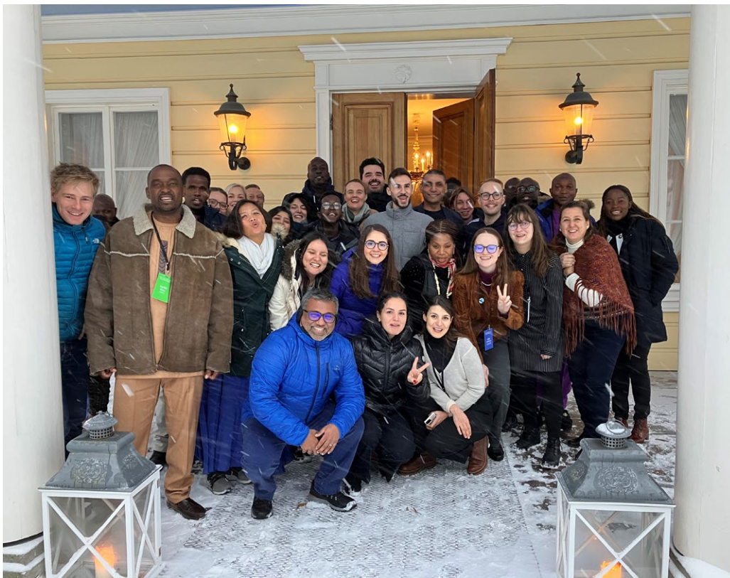
Kuva 12. Suomen järjestämä Nuoret, rauha ja turvallisuus -työpaja toi yhteen nuoria ja virkamenkiloitä eri maista.

Suomi korostaa monipuolisten kumppanuuksien merkitystä rauhan ja kehityksen saavuttamiseksi. Eri sidosryhmien yhteistyö on keskeistä konfliktien ennaltaehkäisyssä, rauhan ylläpitämisessä sekä demokratian ja sääntöpohjaisen kansainvälisen järjestelmän vahvistamisessa. Monipuoliset kumppanuudet ovat Suomelle ominaisia vahvuuksia ja tätä hyödynnetään myös 2250-agendan toimeenpanossa. Kansallisella tasolla merkittävimpiä toimijoita ja kumppaneita ovat ministeriöt ja laitokset, akateeminen yhteisö ja kansalaisjärjestöt, erityisesti nuorisjärjestöt. Kumppanina voi toimia myös elinkeinoelämä, joka tuo nuorille työllistymismahdollisuuksia sekä ammattiyhdistysliike, jolla on osaamista nuorten työntekijöiden oikeuksista ja työhyvinvoinnista. Eduskunnassa on toiminut kaudesta 2019–2023 lähtien Nuoret, rauha ja turvallisuus -toimintaryhmä, joka virallistettiin syksyllä 2024. Ryhmän tavoitteena on lisätä agendan tunnettuutta eduskunnassa sekä vahvistaa yhteistyötä kansalaisyhteiskunnan ja poliittisten päättäjien välillä.