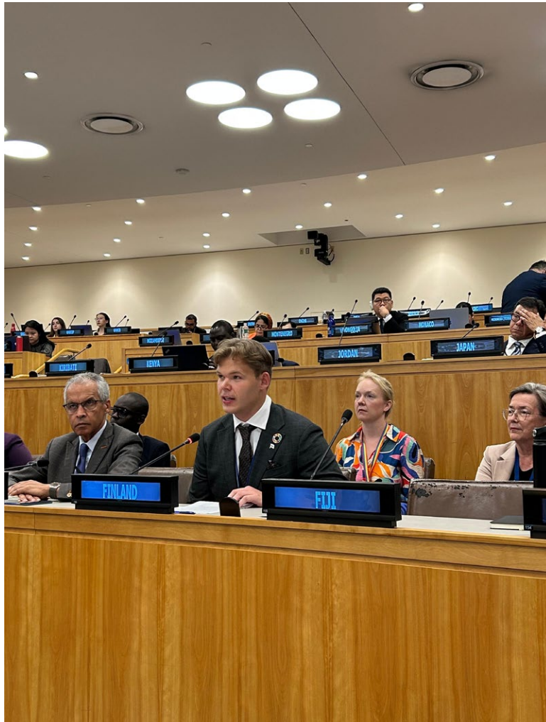
Kuva 5. Suomen YK-nuorisodelegaattiohjelma on toiminut vuodesta 1997 lähtien.

Suomen YK-nuorisodelegaattiohjelma on toiminut vuodesta 1997 lähtien, ja Suomen ilmastodelegaatti on valittu vuodesta 2011 alkaen. Nuorisodelegaattitoimintaa laajennettiin 2010-luvulla Suomen EU-, Unesco-, luonto- ja työelämädelegaatteihin.